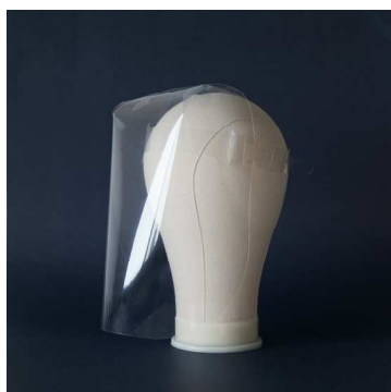
スタンダードタイプ